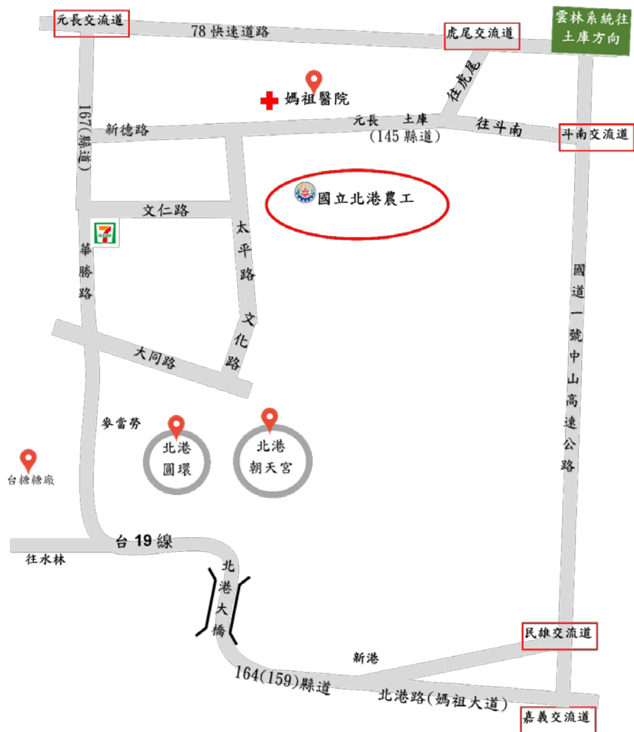
附圖一 國立北港高級農工職業學校位置圖

網址： https://www.pkvs.ylc.edu.tw 聯絡電話：05-7832246#523、626 地址：651005 雲林縣北港鎮太平路 80 號